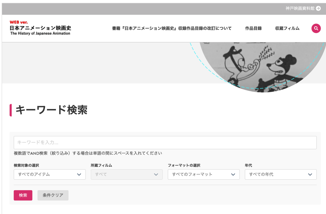
図 2 新しい検索画面

MroongaSearch への移行作業はウェブエンジニアに委託し、フリーワード検索に加え、フィルタ（年代、フォーマットなど）を用いた絞り込み機能を追加したほか、検索結果一覧にサムネイルを表示するなど、本稼働に向け、より使いやすいデータベースとなるようデザイン変更も含めた実装を行っている（図 2・図 3）。